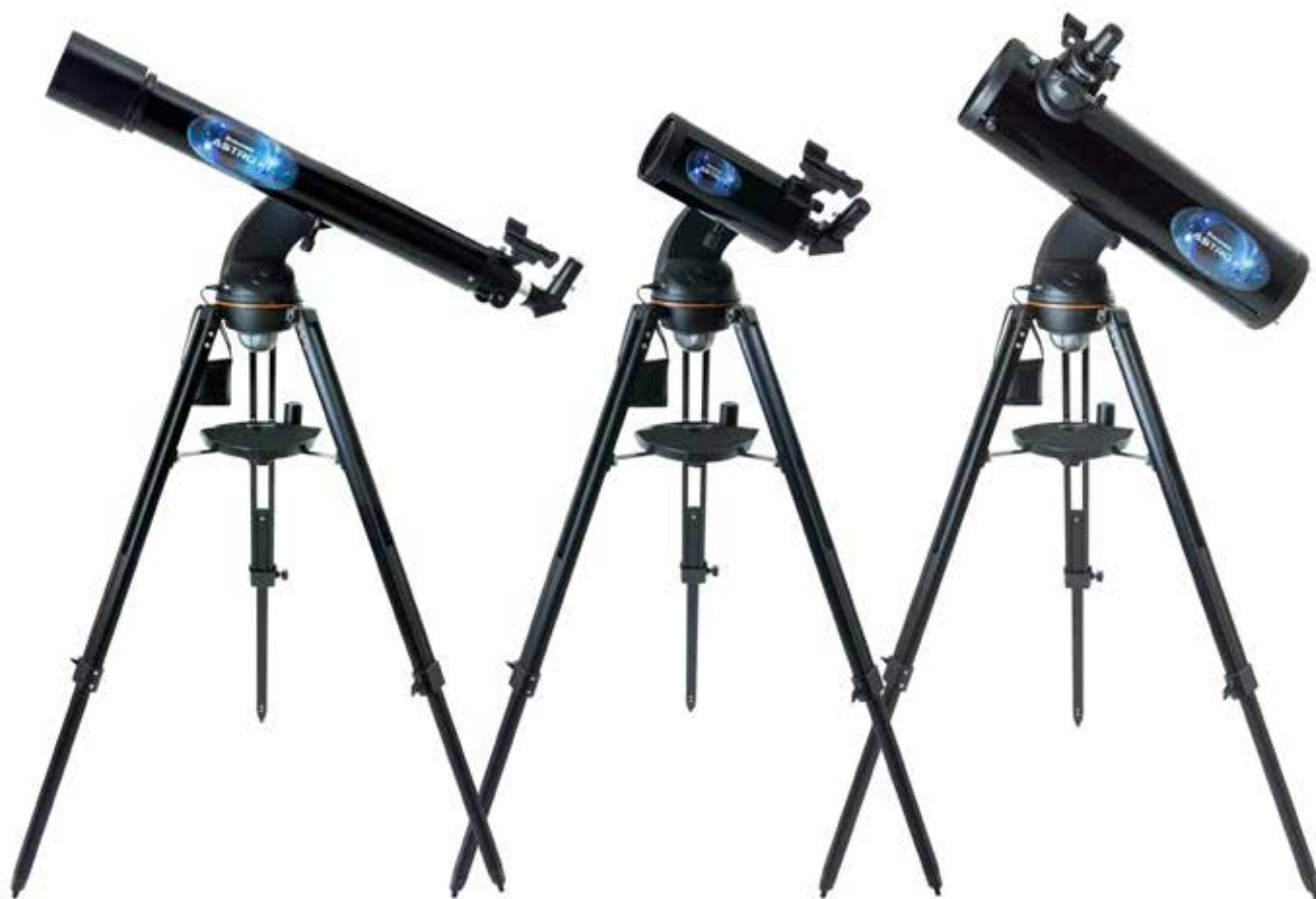
Rifrattore 90 mm