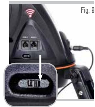
Interrupteur Wi-Fi en position droite

Commencez en pointant des objets terrestres éloignés. Localisez d'abord quelque chose avec votre StarPointer, puis regardez l'objet à l'aide de l'oculaire de 25 mm. Passez à l'oculaire de 10 mm et remarquez comment il augmente le grossissement et diminue le champ de vision. Lorsque vous changez d'oculaires, vous devrez peut-être légèrement réajuster la mise au point pour obtenir une image plus nette.