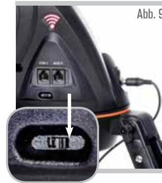
WiFi-Schalter auf rechts position

Beginnen Sie mit dem Anvisieren eines fernen terrestrischen Objekts. Visieren Sie das Objekt zuerst mit Ihrem StarPointer an und schauen Sie anschließend durch Ihr 25-mm-Okular. Wenn Sie nun zum 10-mm-Okular wechseln, werden Sie eine höhere Vergrößerung und ein kleines Sichtfeld realisieren. Beim Wechseln von Okularen muss nachfokussiert werden, um ein scharfes Bild zu erhalten.